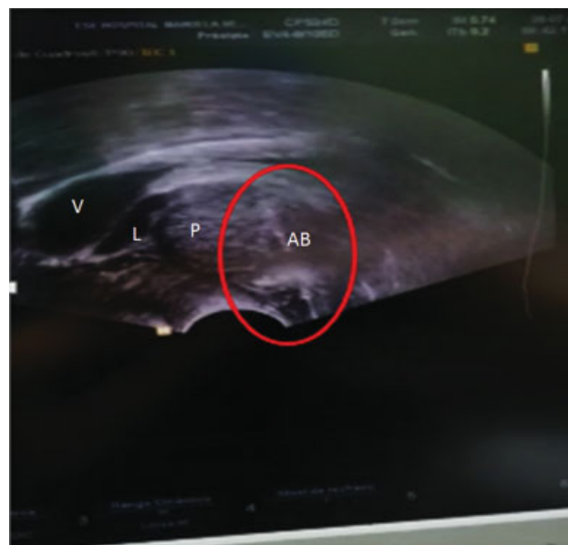
Fig. 2 Vista sagital por ultrasonido de próstata. Abreviaturas: V, vejiga; P, próstata; AB, aguja de biopsia; L, espacio generado por infiltración de lidocaína.

Se analizaron las variables demográficas y clínicas de los pacientes, se determinó la proporción de biopsias positivas