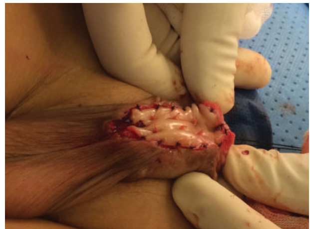
Fig. 5 Injerto de la mucosa oral del carrillo derecho de y fijación a los cuerpos cavernosos con vicryl 5-0.

El tratamiento para la corrección de las hipospadias es quirúrgico. Existen múltiples variaciones entre las técnicas utilizadas para su manejo. Sin embargo, en todas se hace énfasis en la corrección de la curvatura, la uretroplastia y la reconstrucción de la parte ventral del pene.