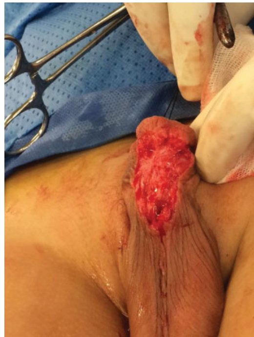
Fig. 4 Resección de tejido fibrótico ventral y la corrección de la curvatura ventral.

minutos. El tiempo de hospitalización fue de 2 días. La sonda se le retiró a las 4 semanas.