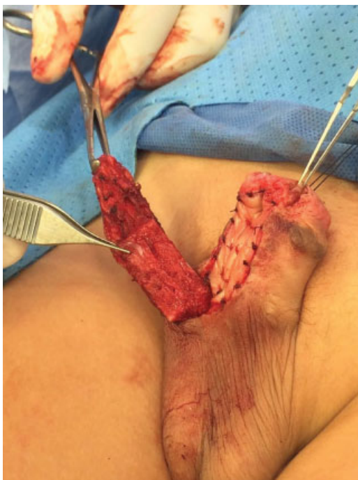
Fig. 7 Apertura de la pseudocapsula del acetato.