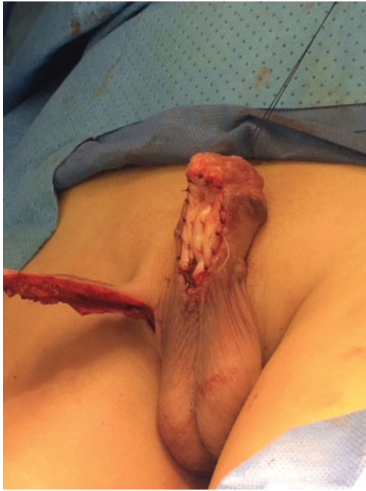
Fig. 6 Tunnelización del colgajo.