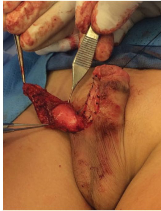
Fig. 8 Fijación al injerto.