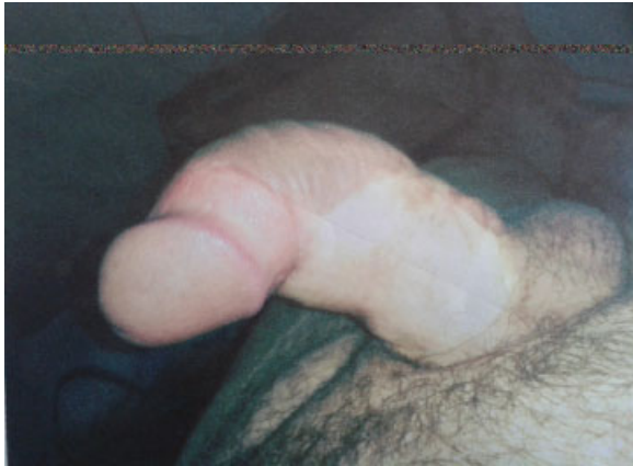
Fig. 1 Curvatura peneana prequirúrgica.

corrección de la curvatura dorsal en un 90%. Se levantan colgajos de piel compuesta hacia dorso de pene y colgajos inferiores distales hasta la corona del glande. Se identifica área con defecto de cubrimiento, de aproximadamente 6 cm × 4 cm. Por los antecedentes de varios injertos y el riesgo de retracción del mismo, se decide realizar un colgajo de pared abdominal, esperar la inmersión del mismo y evitar el riesgo de necrosis, dado por la disminución del riego sanguíneo en el área cruenta secundario a las cirugías previas. Se levanta colgajo de piel a distancia de 8 × 3 cm en la región hipogástrica abdominal y se realiza el anclaje del colgajo en borde distal del defecto de cubrimiento; se deja con sonda uretral. Seis semanas después, es llevado a segundo tiempo quirúrgico, con liberación y remodelación de colgajo de piel de pared abdominal anterior y terminando de realizar el anclaje del colgajo en el borde proximal del defecto; se cierra defecto en la piel del abdomen. No se