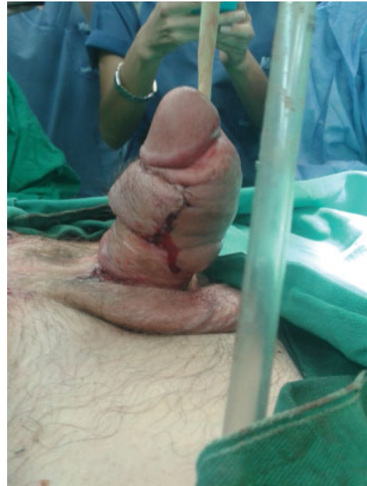
Fig. 3 Resultado del segundo tiempo quirúrgico.

corrección de la curvatura dorsal en un 90%. Se levantan colgajos de piel compuesta hacia dorso de pene y colgajos inferiores distales hasta la corona del glande. Se identifica área con defecto de cubrimiento, de aproximadamente 6 cm × 4 cm. Por los antecedentes de varios injertos y el riesgo de retracción del mismo, se decide realizar un colgajo de pared abdominal, esperar la inmersión del mismo y evitar el riesgo de necrosis, dado por la disminución del riego sanguíneo en el área cruenta secundario a las cirugías previas. Se levanta colgajo de piel a distancia de 8 × 3 cm en la región hipogástrica abdominal y se realiza el anclaje del colgajo en borde distal del defecto de cubrimiento; se deja con sonda uretral. Seis semanas después, es llevado a segundo tiempo quirúrgico, con liberación y remodelación de colgajo de piel de pared abdominal anterior y terminando de realizar el anclaje del colgajo en el borde proximal del defecto; se cierra defecto en la piel del abdomen. No se